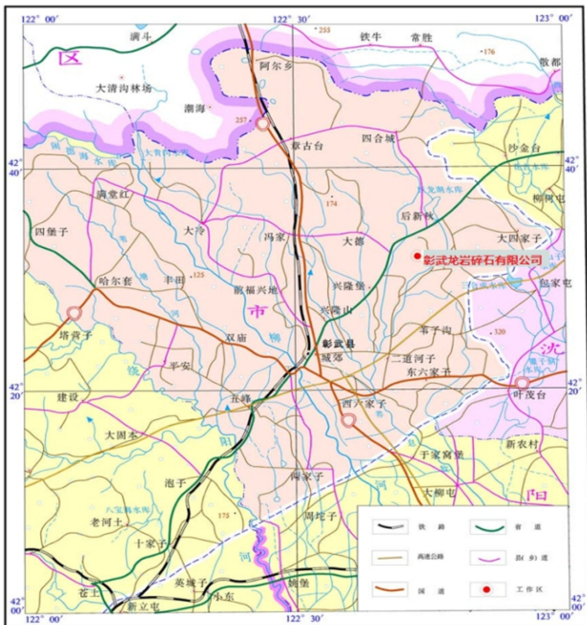
图 3-1 交通位置图

彰武龙岩碎石有限公司建筑用安山岩矿山位于辽宁省阜新市彰武县东北(方位 45^{\circ} )，位于彰武—康平公路南侧，距离彰武县城约 24km，行政区划隶属于兴隆堡乡牯牛海村管辖。矿区中心地理坐标为：东经： 122^{\circ}43'29'' ，北纬： 42^{\circ}32'32'' 。矿区附近有彰武—康平线公路经过，并有乡级公路从矿区通过，交通较为便利，矿区交通位置见图 3-1。