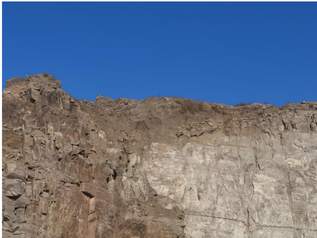
图 3-5 土壤剖面图

矿区内及其附近土壤类型主要为褐土，土层厚度为 0.2~0.8m 左右，丘陵坡地处基岩裸露。成土母岩为安山岩风化残坡积物，属幼年土壤，粘粒含量低，结合力弱，极易产生水土流失和土壤侵蚀，矿区内土壤，现阶段已被全部剥离。土壤有机质含量 1.0%—1.2%，土壤 PH 值在 7.3—7.6 之间，肥力差。项目区典型土层剖面见图 3-5。