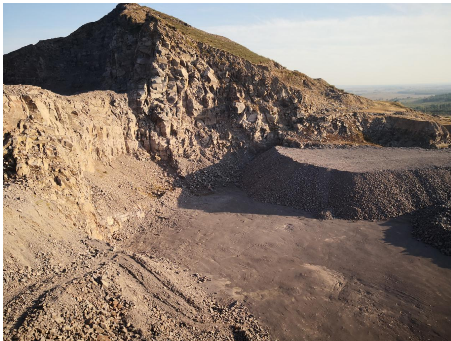
图 3-3 项目区地形地貌