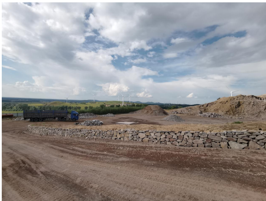
图 3-4 项目区植被情况

项目区属蒙植物系、长白植物系和华北植物区系交汇地带，采区大部分地段基岩裸露，植被覆盖率低。植被类型主要为天然草地。草类植物主要有隐子草、碱草、苔草、狗尾巴草、野豌豆、车前子及羊草等。乔木主要有人工种植的柳树和本地柠条。项目区典型植被见图 3-4。