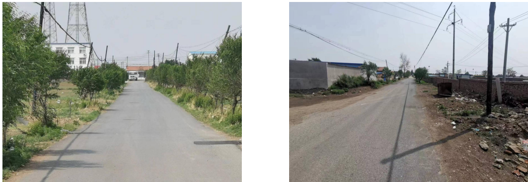
图 3-2 地形地貌图